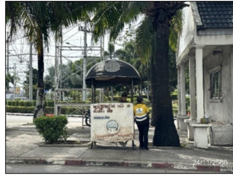
ภาพที่ 2.2-14 เจ้าหน้าที่จราจรคอยอำนวยความสะดวก