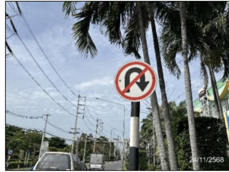
ป้ายห้ามกลับรถ