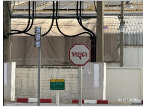
ป้ายหยุด