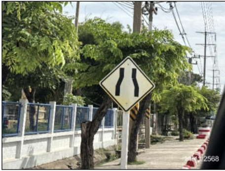
ป้ายเตือนทางแคบ