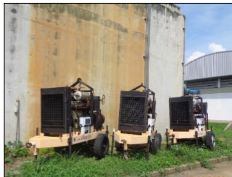
ภาพที่ 2.2-12 เครื่องสูบน้ำสำรอง