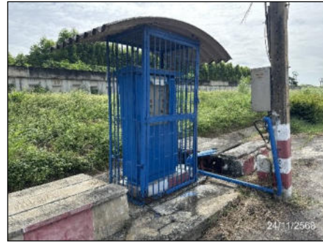
ภาพที่ 2.2-5 รางระบายน้ำฝนและท่อรวบรวมน้ำเสีย