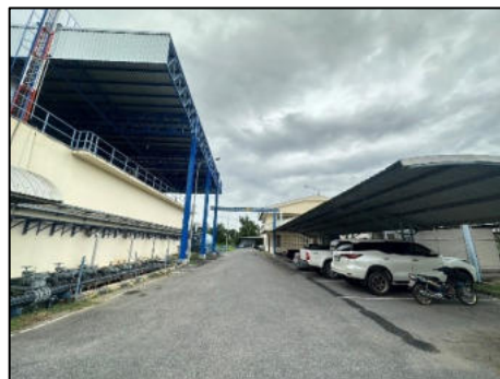
ภาพที่ 2.2-7 โรงผลิตน้ำเพื่ออุตสาหกรรม