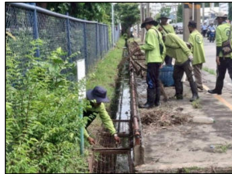
ภาพที่ 2.2-6 การกำจัดวัชพืชและขยะมูลฝอยในคลองสาธารณะในพื้นที่โครงการ