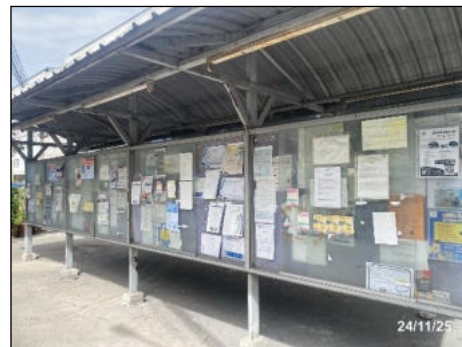
ภาพที่ 2.2-15 บอร์ดประชาสัมพันธ์รับสมัครงาน