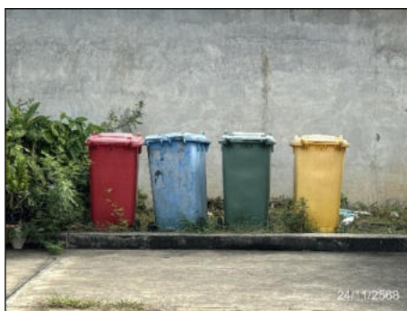
ภาพที่ 2.2-8 ภาพขยะรองรับขยะภายในโครงการ