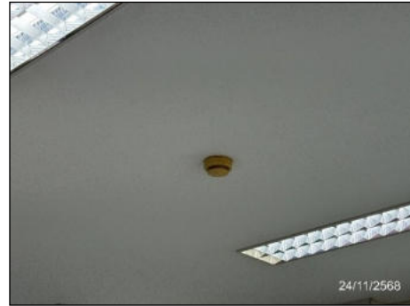
อุปกรณ์ตรวจจับควัน