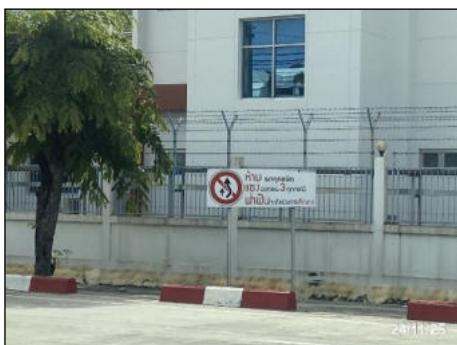
ป้ายห้ามแซง