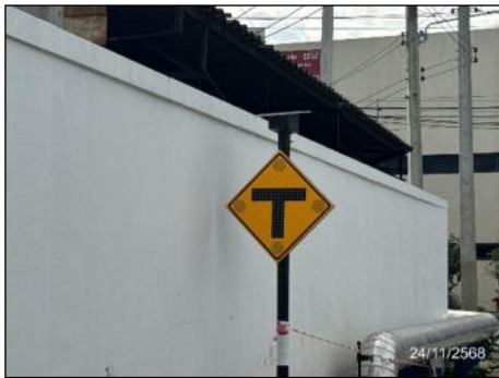
ป้ายทางแยก