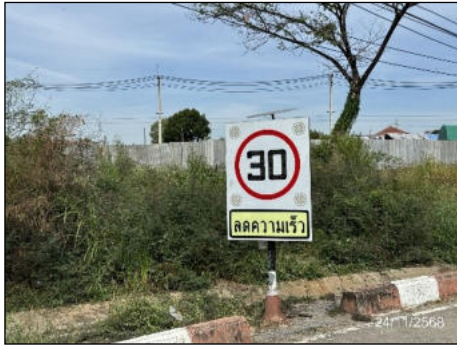
ป้ายจำกัดความเร็ว