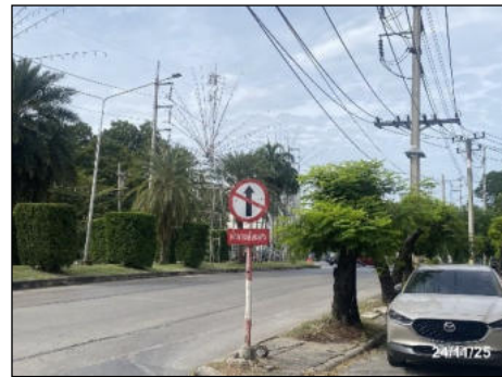
ป้ายห้ามรถย้อนศร