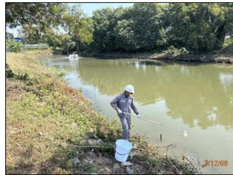
บ่อหนองน้ำฝนที่ 4