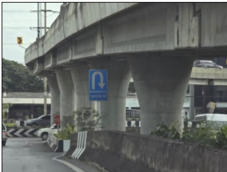
ป้ายจุดกลับรถ