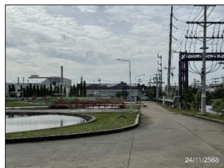
ภาพที่ 2.2-1 สภาพทั่วไปภายในโครงการเขตปลอดสารอันตราย