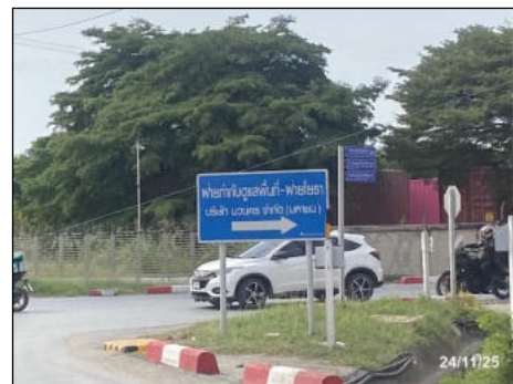
ภาพที่ 2.2-13 ป้ายบอกตำแหน่งโครงการ