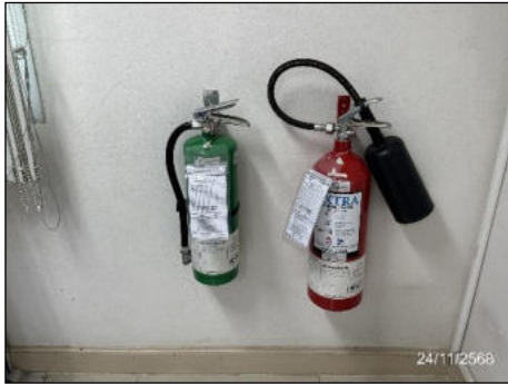
ถังดับเพลิงเคมี