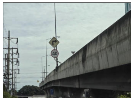
สะพานกลับรถข้ามถนนพหลโยธิน