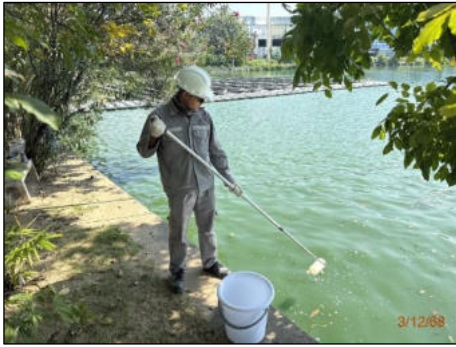
บ่อหนองน้ำฝนที่ 1