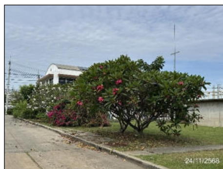
ภาพที่ 2.2-3 พื้นที่สีเขียวและแนวกันชนของโครงการ (Buffer Zone)