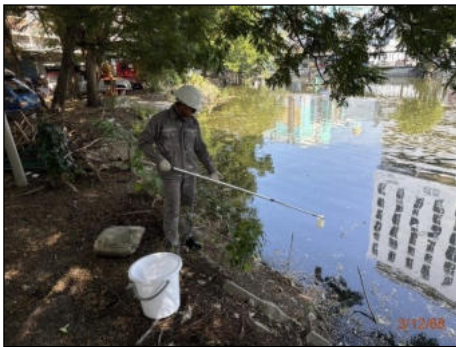
บ่อหนองน้ำฝนที่ 3