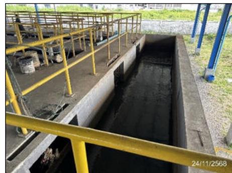
ภาพที่ 2.2-2 ระบบบำบัดน้ำเสียส่วนกลาง