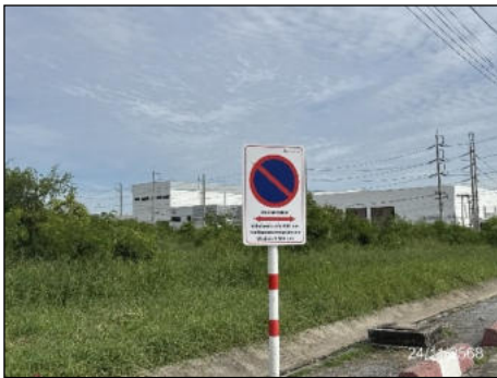
ป้ายห้ามจอด