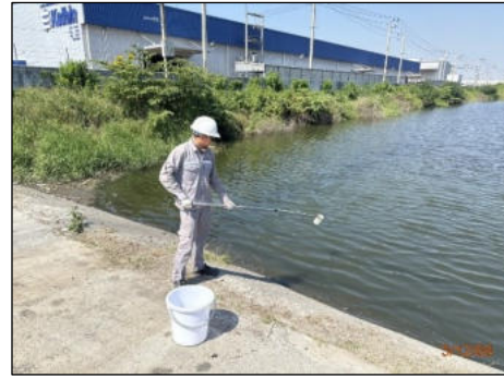
บ่อหนองน้ำฝนที่ 2