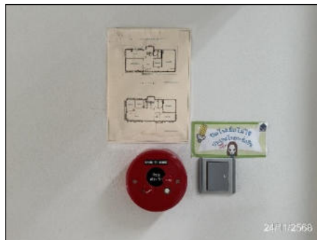
แผนผังอพยพหนีไฟ