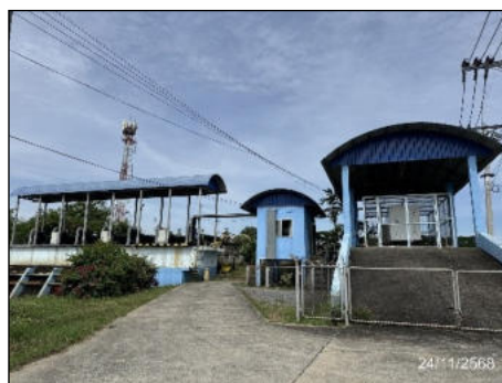
ภาพที่ 2.2-10 สถานีสูบน้ำและสถานีเฝ้าระวังปริมาณน้ำฝน