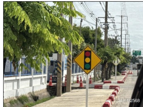
ป้ายเตือนสัญญาณไฟ