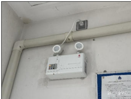
ไฟสำรองฉุกเฉิน