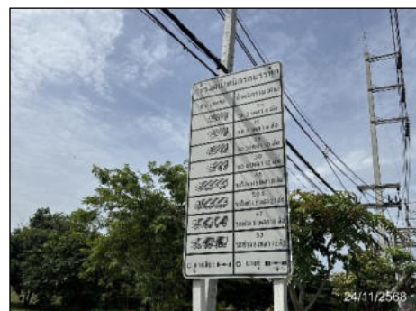
ป้ายควบคุมน้ำหนักรถ