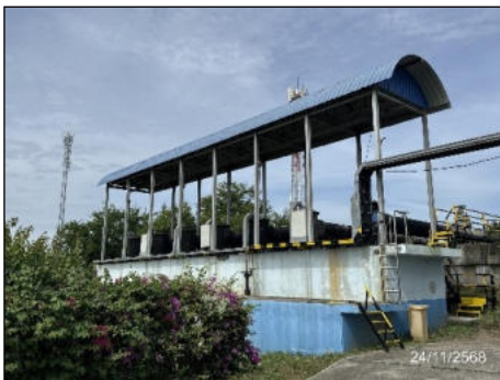
ภาพที่ 2.2-9 บ่อหนองน้ำฝนภายในพื้นที่โครงการ