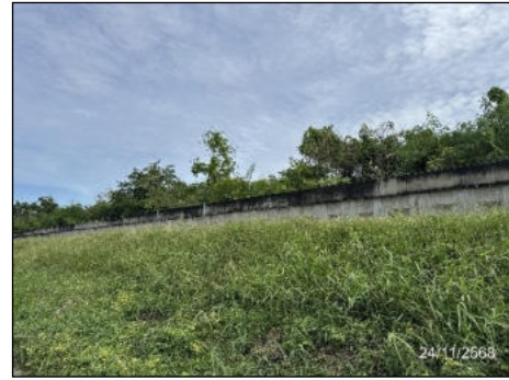
ภาพที่ 2.2-11 เชื้อน/คันดินป้องกันน้ำท่วม