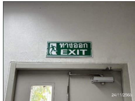
ป้ายบอกทางหนีไฟ